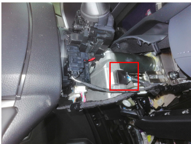
Место подключения для разблокировки руля