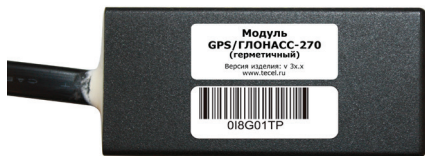
Рис. 3. Общий вид модуля GPS/ГЛОНАСС-270 (герметичный)