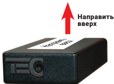
Рис. 6. Размещение модуля GPS/ГЛОНАСС-270 (герметичный) в автомобиле

! Наличие в автомобиле теплозащитного/звукоизолирующего лобового стекла с беспроводным обогревом создает помехи для спутникового сигнала. Рекомендуем использование модуля GPS/ГЛОНАСС-270 (герметичный) и размещение вне салона автомобиля в подкапотном пространстве.