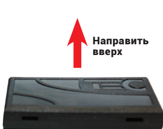
Рис. 5. Размещение модуля GPS/ГЛОНАСС-270 в автомобиле

Уверенный прием сигнала делает модуль не очень требовательным к месту установки, однако следует учесть, что зона наиболее уверенного приема сигнала со спутников – у лобового стекла автомобиля. Расположите модуль горизонтально (см. рисунок 5 и 6). Допускается установка модуля под пластиковые и резиновые детали автомобиля.