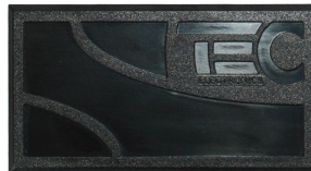
Рис. 4. Общий вид модуля GPS/ГЛОНАСС-270 (обычный)