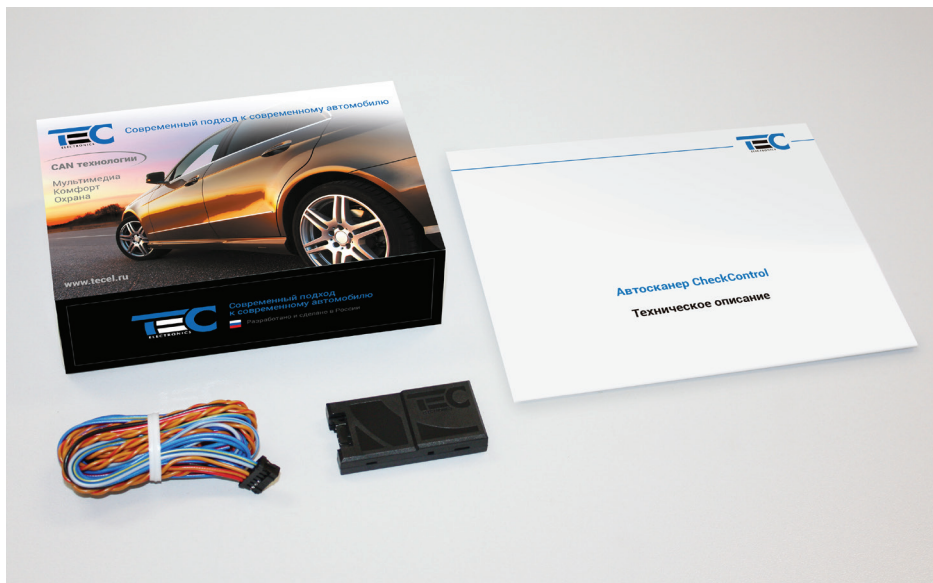
Рис. 1. Комплект поставки

Автосканер CheckControl (далее – автосканер) работает с системами Призрак-8xx/2USB, Призрак-8xx/ДТ, FanControl-GSM, модулями FanControl-U2/B2 или со сторонними изделиями управления отопителем. Автосканер позволяет осуществлять диагностику автомобиля по протоколу OBD-II и удалять, в том числе и автоматически, коды неисправностей блока управления двигателя. Протокол OBD-II: ISO15765 (500 kBit/s, 11 Bit ID).