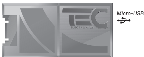
Рис. 2. Автосканер CheckControl

Настройка автосканера (способ стирания кодов ошибок, назначение входов, и т.п.) производится с помощью TECprog.