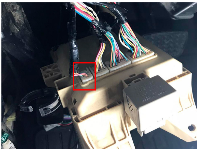
Место подключения к цепям запуска двигателя

Подключение производится на основной блоке ECU за перчаточным ящиком в белом крайнем разъеме со стороны моторного щита.